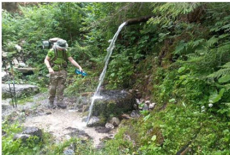
Prameň za Troma vodami

Uťahaní, ako sibírski huskyovia, s príchodom na Tri vody mierime rovno do prístrešku a varíme aspoň sáčkovú polievku vylepšenú o cestoviny. Ešte nás čaká skoro 400 m výstup a 6 km do Sedla pod Hrbom.