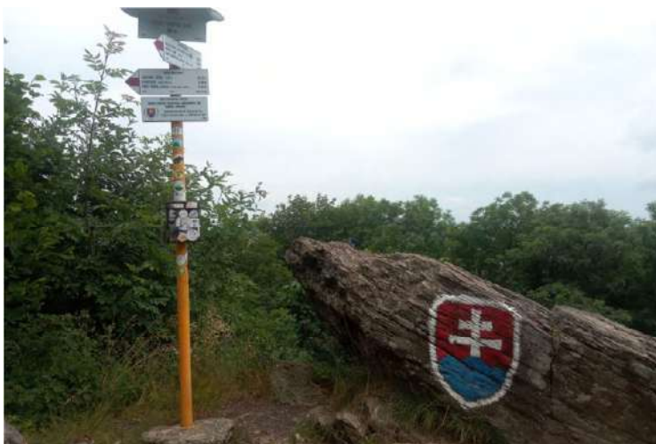
Na vrchole Pohronského Inovca