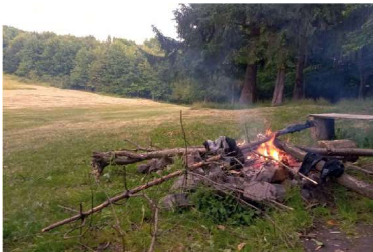
Večerná pohoda a sušenie vecí