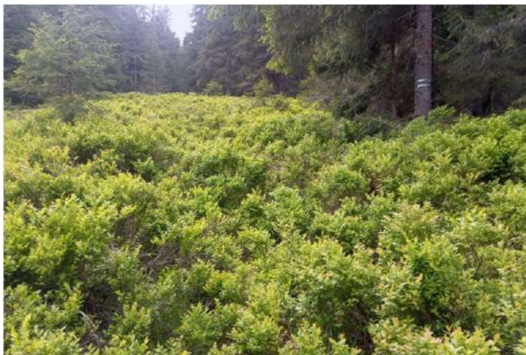
"Chodníkom" na Kyprov

Z cesty sa stáva cestička čučoriedkovými kríkmi, kľukatiaca sa ako meandre Hronu. Nikde ani živej duše, len ticho hôr. Preliezame Kyprovom, nasleduje krátke strmé klesanie do Slanského sedla a naspäť znova prudšie stúpanie do pohlcujúcej, hustej, nedotknutej a krásnej divočiny. Po slalomoch, preliezaní a podliezaní stromov sa v eufórii dostávame na vrch Stolica, kde pre nás začína vysnívaná Rudná magistrála. Pred nami je 240 km, zatiaľ zahalených tajomstvom.