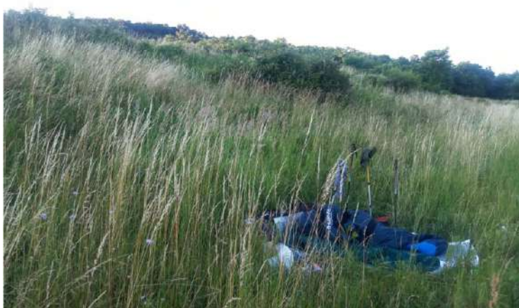
Žitavany - Vříšky