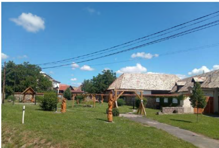
V centre Babinej