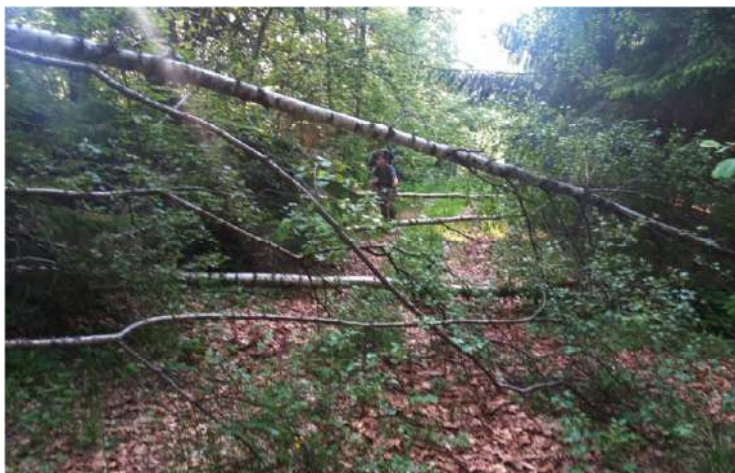
Cestou na Machniarku

Chodník okolo Šopiska je totálne nepriechodný, tak ho kopírujeme paralelne po blízkej lúke. Po príchode na lazy Drábsko – Kysuca identifikujeme v diaľke Poľanu. K nej nám to potrvá šliapať ešte asi ďalšie dva dni.