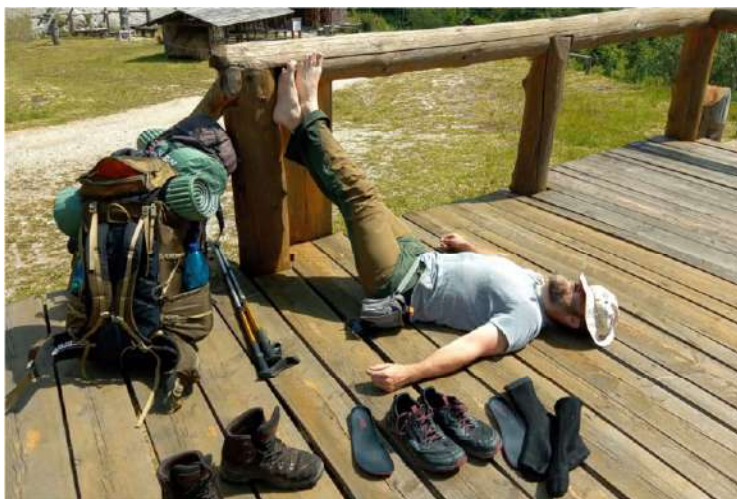
Pri horskej chatke Burda

V Sedle Burda nám oči rozžiari ďalšia krásna lúka a výhľady. Je to taká križovatka medzi Tisovcom a Závadkou nad Hronom, no tie sú tak 12 - 13 km vzdialené. V jednej doline pramení Rimava, v druhej Hronec.