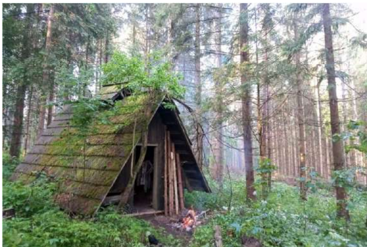
V Sedle Javorinka

Do Sedla Javorinka sú to ešte asi dva kilometre a s úbytkom našej energie slabne i dážď. Na noc nás prichýli zubom času načatý malý prístrešok, kde aspoň čiastočne sušíme veci a môžeme načerpať sily na ďalší deň.