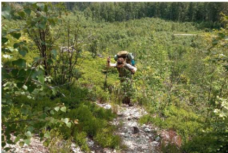
Výstup na Tri kopce

Fabovou hoľou. Neďaleko stúpania je i prameň spomínanej Rimavy, no cesta je taká hustá, že na "prieskum" ani nemyslíme. V diaľke vidno pohorie Nízkyh Tatier - spomínam na cestu ich hrebeňom a Samkovi identifikujem jednotlivé vrchy. V pauzách si vyrovnávame kyslíkový dlh a kocháme sa okolitou prírodou. Kde sa pozriem, samé hory.