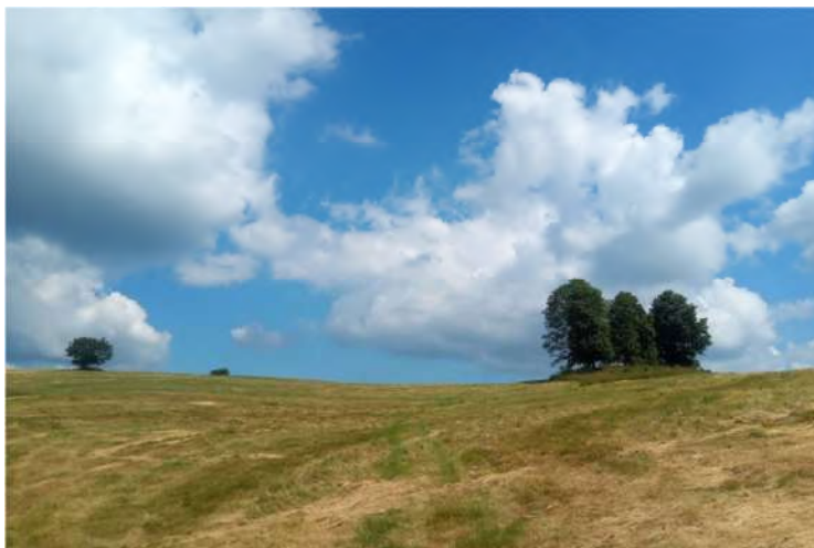
Cestou k Richňavskému jazeru

Známou príjemnou trasou cez lúčky a lesíky opúšťame Štiavnické Bane. Chodník vedie popri odvodňovacích žľaboch, kde obdivujem majstrovstvo (ale aj drinu) „našich“ dedov. Cestou si spievam, pískam a som šťastný.