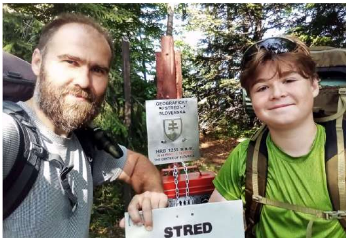
Vrchol Hrb a geografický stred Slovenska