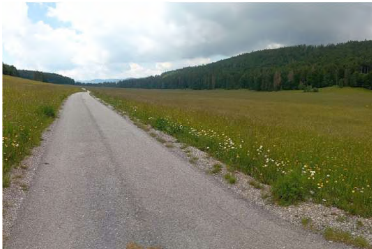
Muránska Veľká lúka

takúto turistiku výborné a aj dobre chutí. Stretávame niekoľkých cyklistov a bobrích návštevníkov.