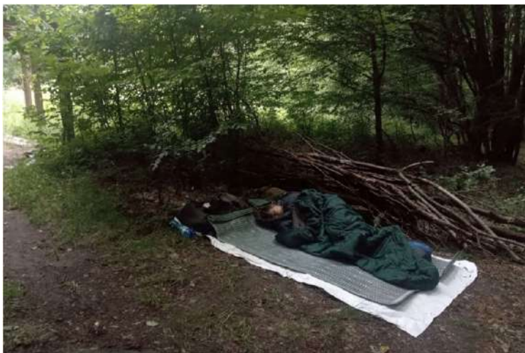
Nocľah v Sáskej doline