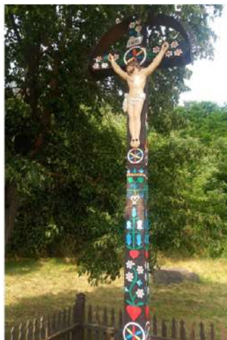
Detvianske vyrezávané kríže

Zasa som nepočúval synovu intuíciu a namiesto hladkého preletu Detvou, sa ešte raz vraciame do centra. Zo zbytočných kilometrov navyše si aspoň niečo ušetríme MHD-čkou. Stretávame však milých ľudí, ktorí sa prihovárajú, držia päste a želajú šťastnú cestu.