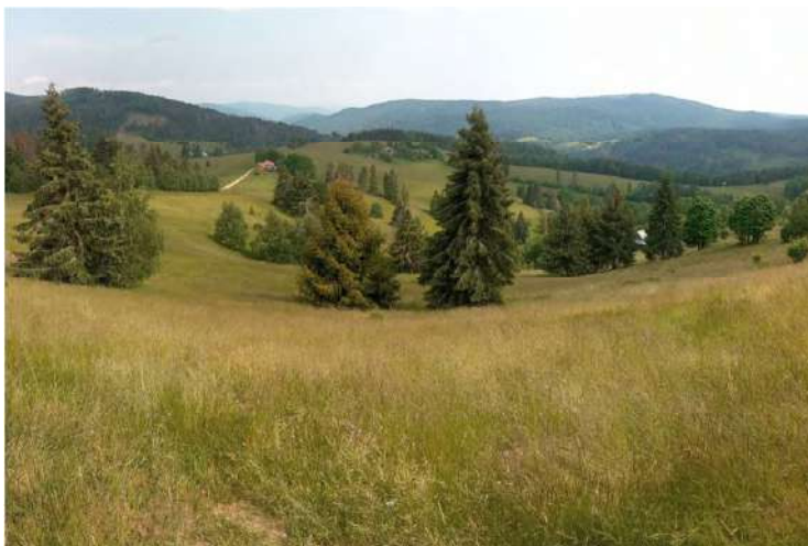
Lazy Drábsko - Kysuca