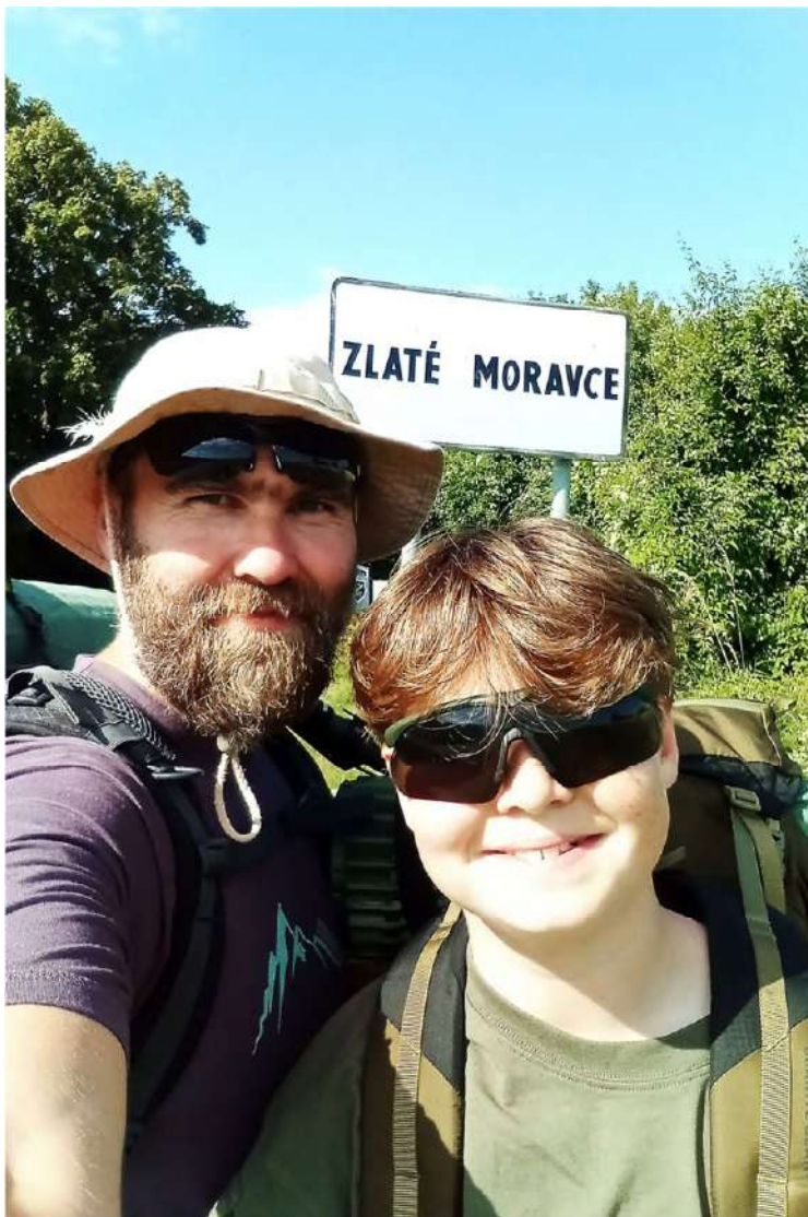
V cieľovej etape