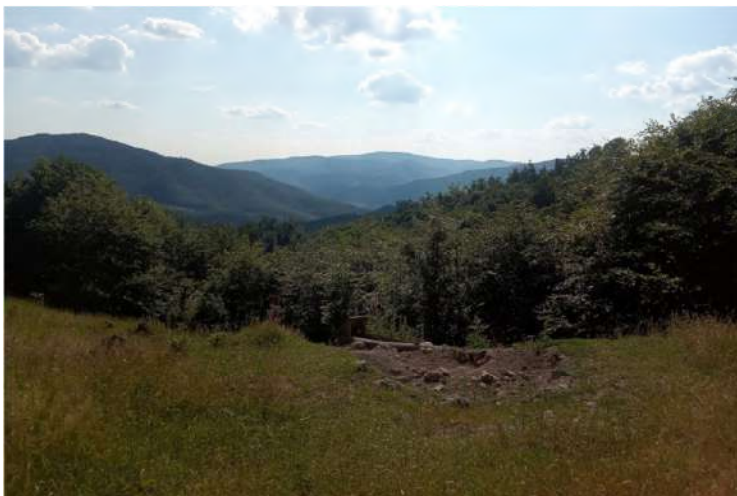
Prechod do Rudna nad Hronom