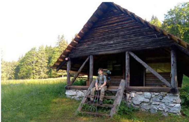
Útulňa na Nižnej Kľakovej