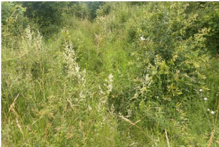
"Chodník" za obcou Sása