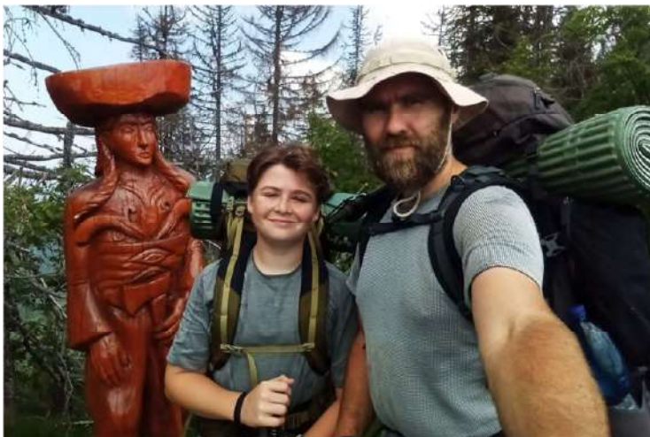
Na vrchu Klenovský Vepor