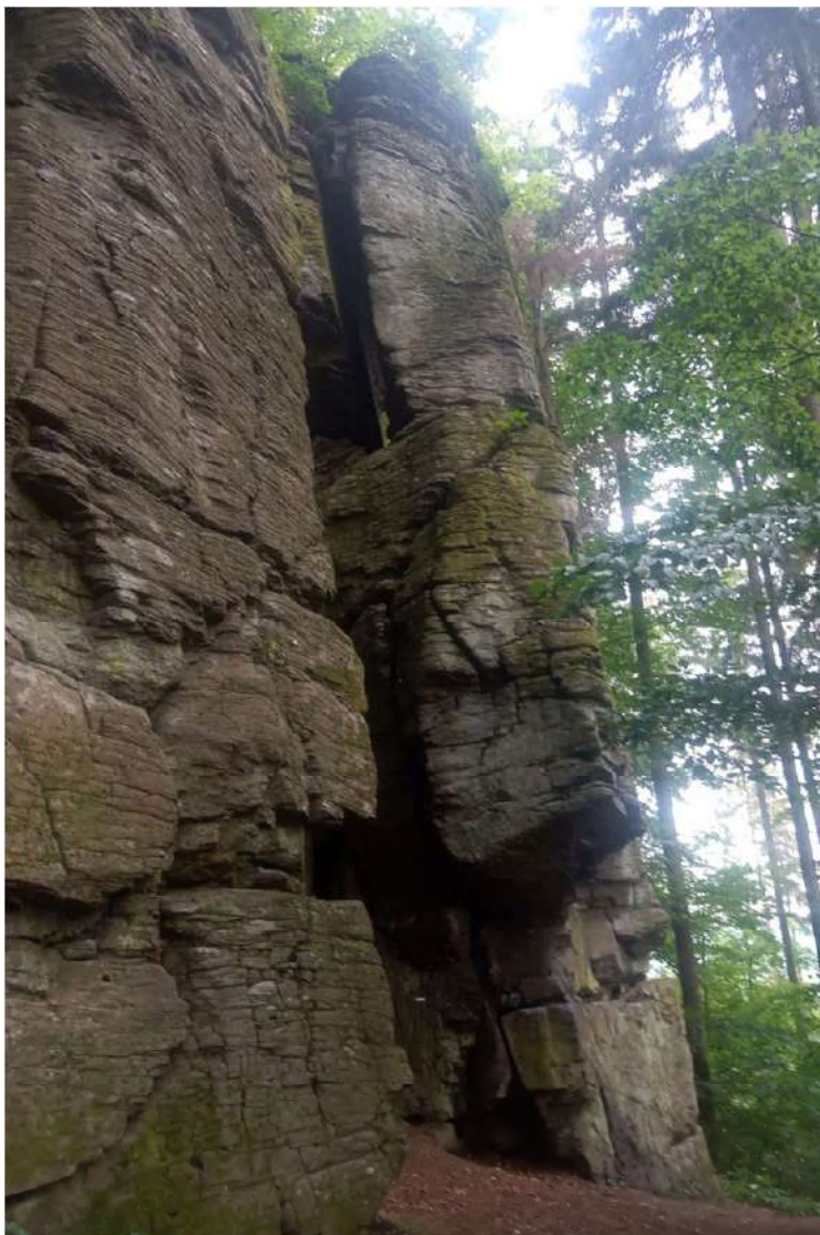
Skaly Prírodnej rezervácie Kalamárka