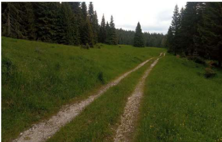
Národným parkom Muránska planina

vynovená útulňa na Nižnej Kľakovej, ktorá nás ochráni pred dažďom a ďalšou veľmi chladnou nocou.