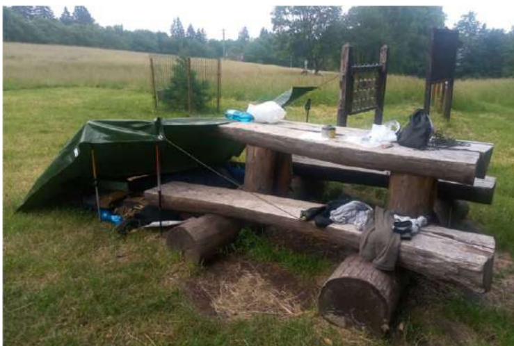
Oddychové miesto a nocľah na Kalamárke