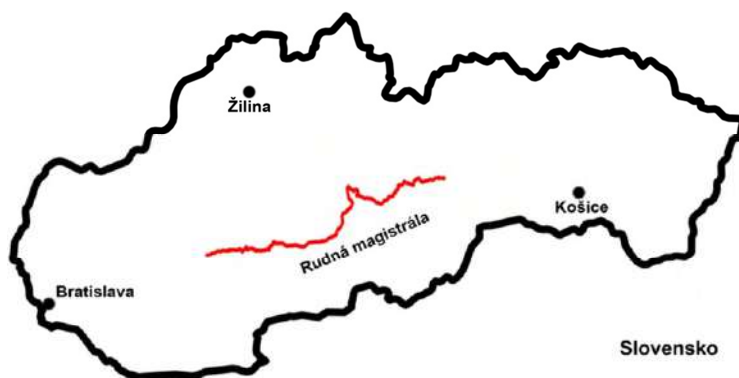
Trasa a poloha magistrály