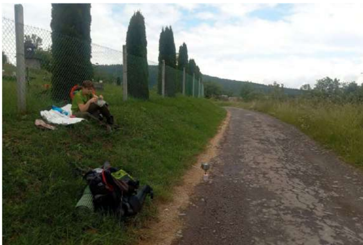
Za osadou Blýskavica

držím v ruke častejšie ako moderný tinedžer. Do osady Blýskavica nás čaká ešte malá „Rambo“ dráha a z vysokej trávy a buriny mám topánky a gate komplet mokré až po pás. Tretie štádium mokrých topánok znamená, že pri kráčaní v nich čvrká voda. Nepomohli mi ani nepremokavé ponožky. Keď sa ukáže zasa slnko, na konci osady sa povzbudíme teplou polievkou. Niet tu však roviny, tak varič rozkladáme na kraji cesty pri cintoríne.