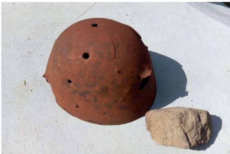
Pri pamätníku SNP