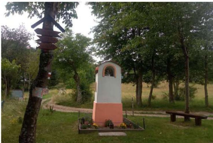
Výklenková kaplnka pred Osadou Bukovina