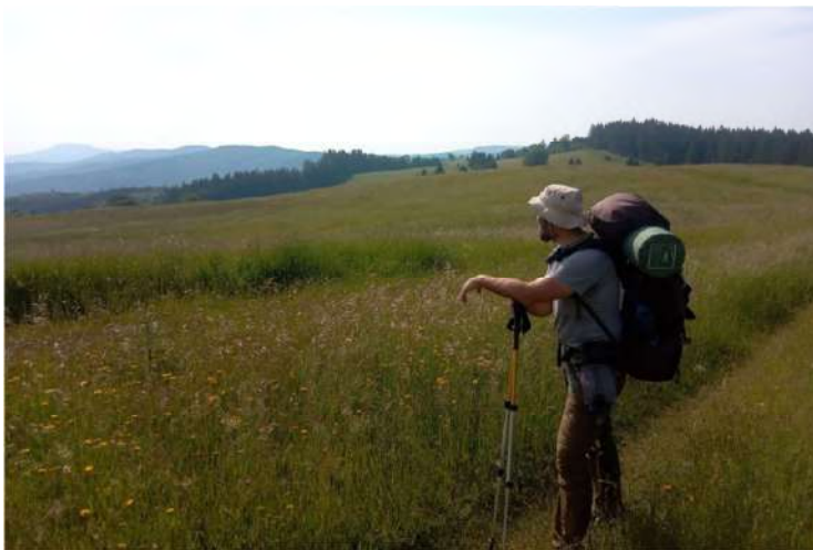
Pred Zákľukami, hore vľavo Klenovský Vepor

Pri vodnej nádrži Hrončok naberáme vodu z prameňa, doprajeme si dlhšiu prestávku a mňa to láme na spánok.