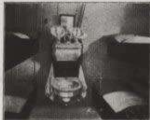
THIRD CLASS FOUR BERTH ROOM

Spacious Dining Saloons Smoking Room Ladies' Reading Room Covered Promenade