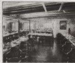
THIRD CLASS DINING SALOON

All passengers berthed in closed rooms containing 2, 4, or 6 berths, a large number equipped with washstands, etc.