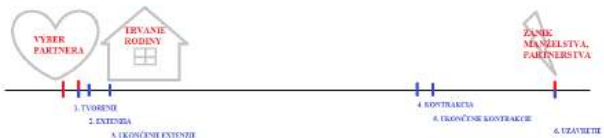
Obr. 1 Životný cyklus rodiny

Podoba tohto životného cyklu (Obr.1) závisí od jednotlivých typov rodín, počtu detí v rodine, spôsobu preberania jednotlivých rolí a hlavne adaptácie na jednotlivé životné situácie. Začína sa obdobím výberu partnera , ktoré významným spôsobom ovplyvňuje celý životný cyklus rodiny. Spravidla najdlhším obdobím je trvanie rodiny , ktoré sa ďalej člení na ďalších šesť štádií (tvorenie, extenzia, ukončenie extenzie, kontrakcia, ukončenie kontrakcie a uzavretie). Životný cyklus sa končí obdobím zániku manželstva/partnerstva , no nemožno povedať, že tým zaniká aj rodina ako taká, pretože vzťahy jedného alebo oboch rodičov s deťmi pretrvávajú. Všetky obdobia ale aj štádiá sa vyvíjajú a trvajú v každej rodine individuálne .