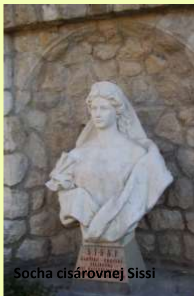
Socha cisárovnej Sissi