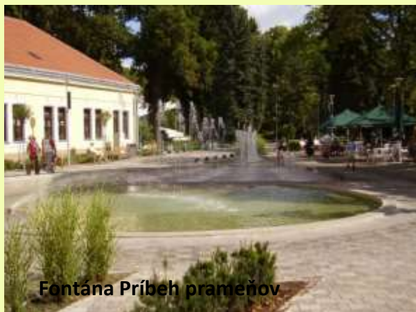
Fontána Príbeh prameňov