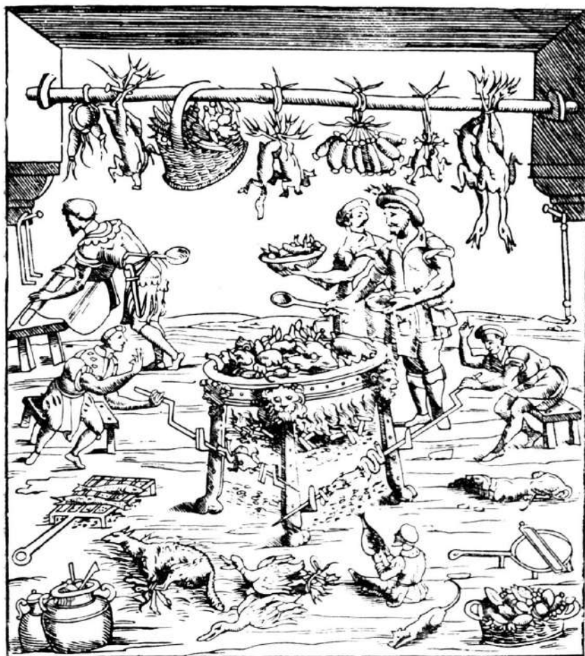
Obr. 4. Vnitřek italské kuchyně. (Dřevoryt z kuchařské knihy Christ. de Messisburgo, »Banchetti compositioni di vivende«, Ferrara 1549)

Málo slušných mravů prozrazuje, nabízíš-li jinému, co jsi sám zpola snědl. Chléb nakousnutý opět dávatí do omáčky je selské, jakož není také úhledno, v ústech jsoucí jídlo vyndavati a klásti na chleba. Vzal-lis náhodou něco, čeho nemůžeš spolknouti, pak jest ti