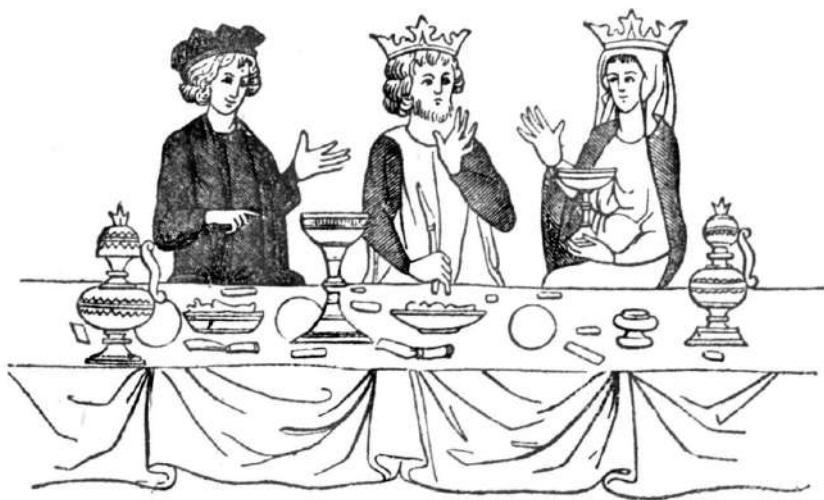
Obr. 1. Tabule u francouzského barona ve 13. století. (Miniatura z Histoire de Saint Graal, rukopis Národní knihovny pařížské.)

Hostina skládávala se jako již za stará z několika částí. Ve Francii jim říkali „service“. První services hostiny sluly mets nebo assiettes, poslední entremés, dorures, desserte, issue de table a boute-hors.