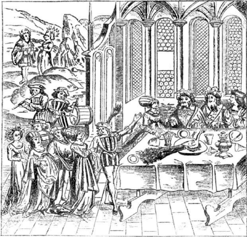
Obr. 3. Slavnostní hostina ve století 16. (Dřevoryt vydaný r. 1517 v Lyonu).