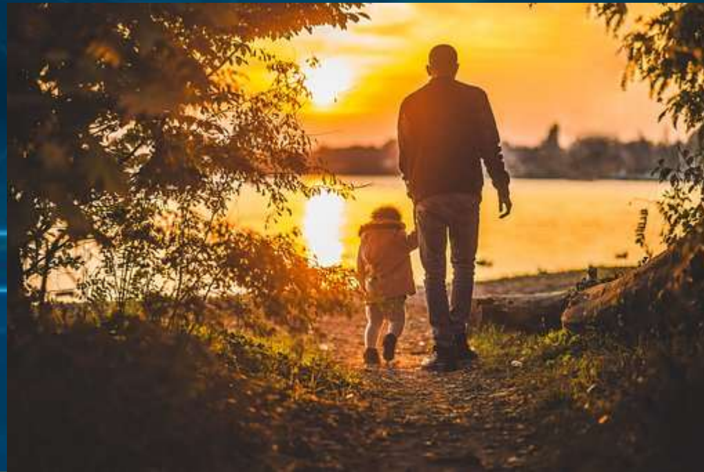
Foto Dad