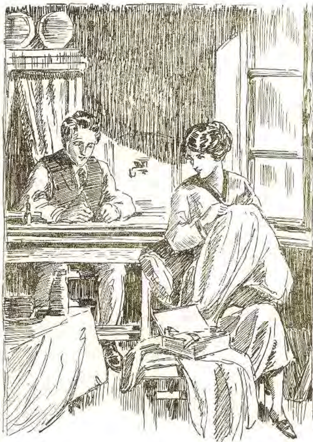
Rýsoval a kreslil na velkém kuchyňském stole...