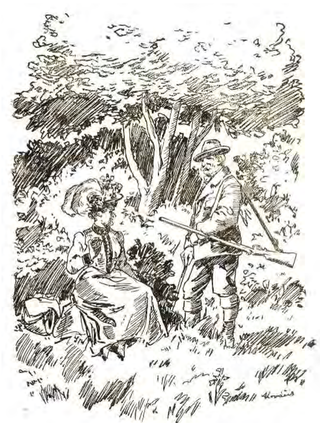
Kupcová seděla malebně rozložena...

„Zatrápená ochechule,“ myslí si pan lesní a nahlas říká: „To můžeme,“ a škubne mu trochu rty. „Ale tady na cestě ne. To vím o lepším místě. Tuhle vpravo je takový krásný kopeček zrovna jako sedátko.“